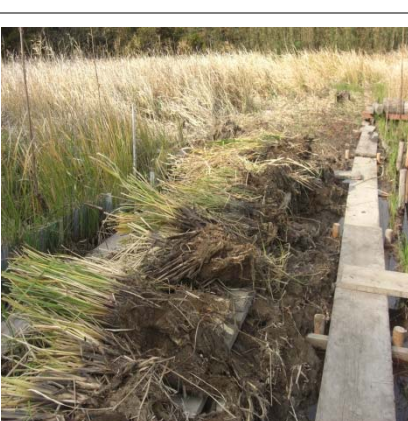
天日乾燥 (ザリガニ駆除)