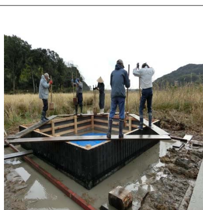
埋設作業(打ち込み固定)