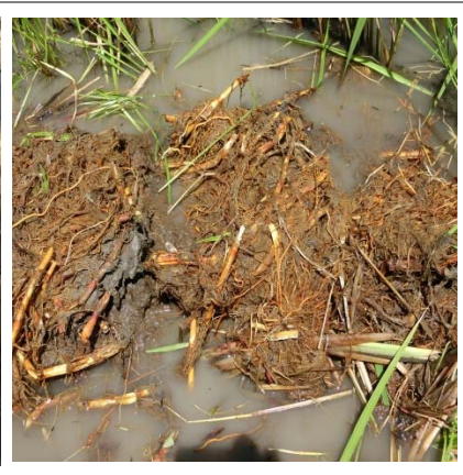
マコモが繁茂、水面が見えない