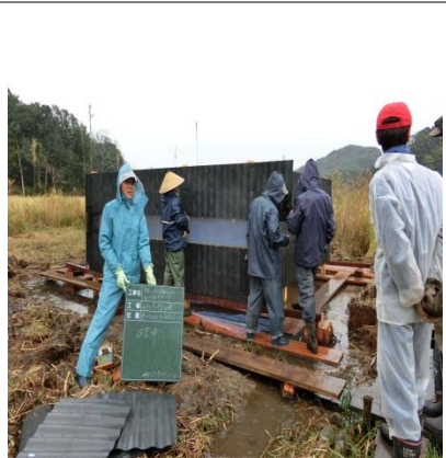
柵板取り付 (内側ネット張り)