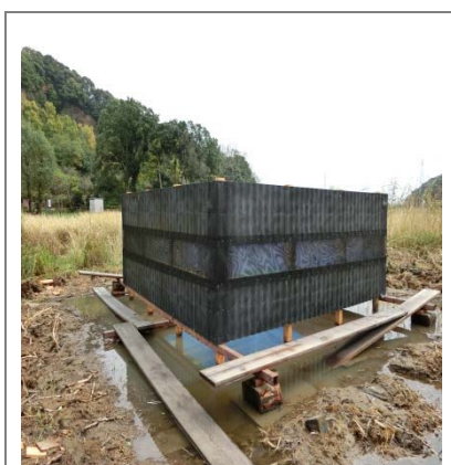
生簀組立完了(中央は通水路)