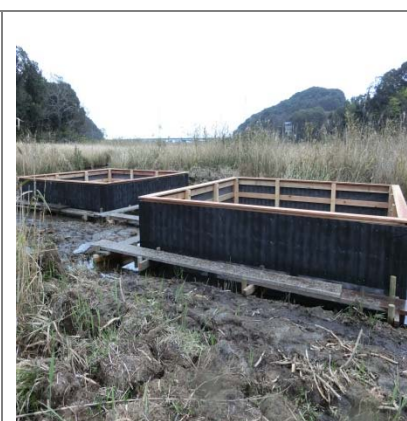
新型生簀 2・3号完成