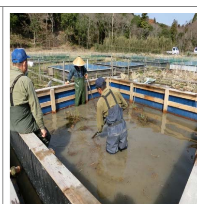
マコモ移植 (4月増殖 5月産卵)