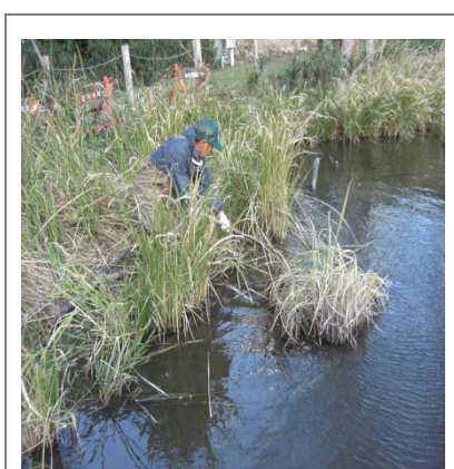
移植用マコモの抜き取り